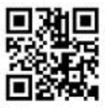
飯田コアカレッジ 携帯サイト