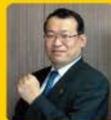
飯田市長 牧野 光朗